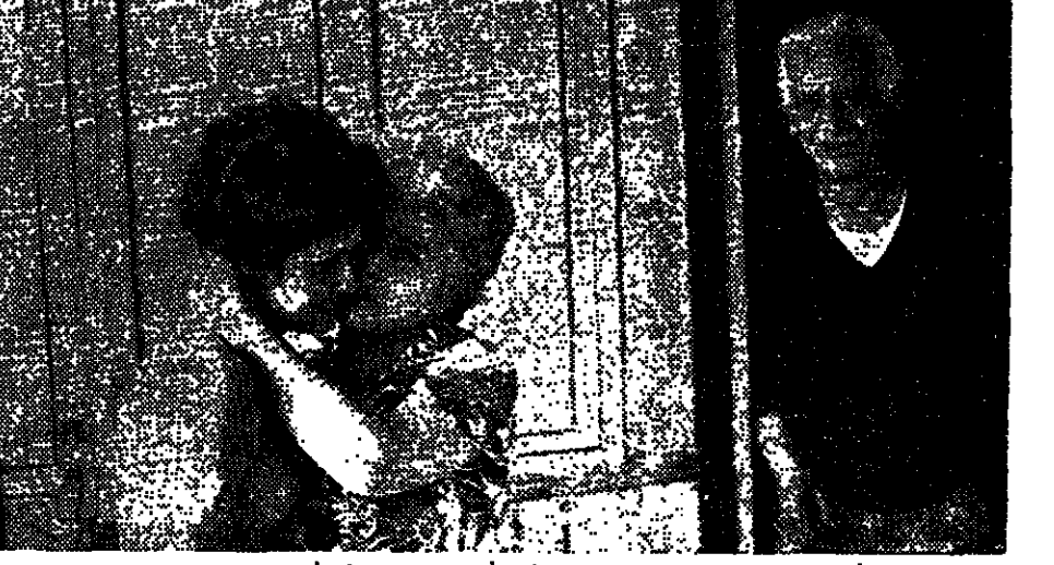
בני עם בעלה ופנתה כחודש רב חזרה.

צדד 15 מדרשלים במסד צדד 15 מדרשלים במסד צדד 15 מדרשלים במסד